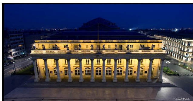
Grand théâtre de Bordeaux